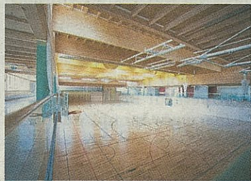
In Hagenberg steht die energieeffizienteste Sporthalle Oberösterreichs.