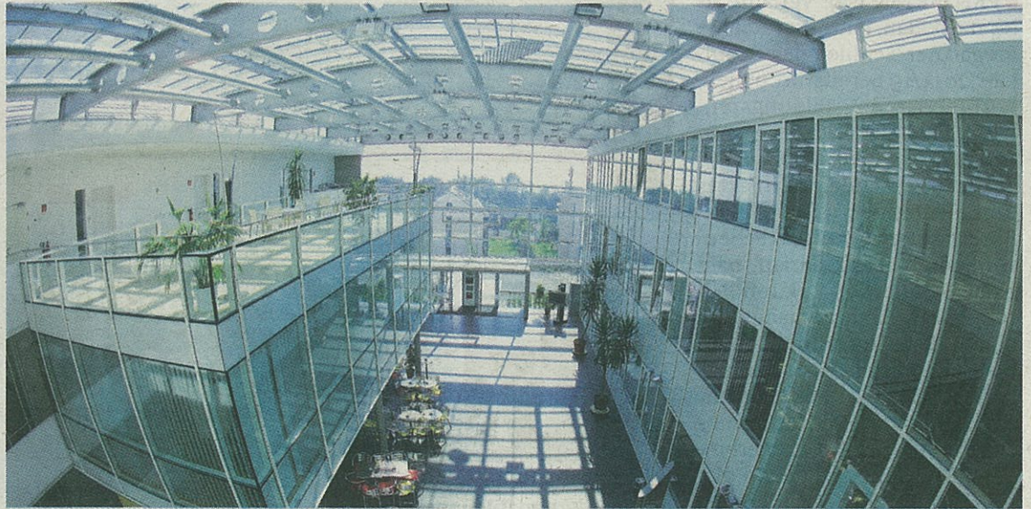
Innovativ sind nicht nur die Ideen, sondern auch die Gebäude selbst.